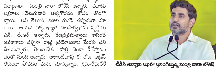
టిడిపి ఆవిర్భావ సభలో ప్రసంగిస్తున్న మంత్రి నారా లోకేశ్

విజయవాడ, మార్చి 29 ప్రభాతవార్త ప్రతినిధి: రాజకీయాల్లో రికార్డులు సృష్టించాలన్నా, ఆ రికార్డులు బద్దలు కొట్టాలన్నా ఆది కేవలం ఒక్క తెలుగుదేశం పార్టీతోనే సాధ్యమని టీడీపీ జాతీయ ప్రధాన కార్యదర్శి, ఏపీ విద్యాశాఖా మంత్రి నారా లోకేశ్ అన్నారు. మూడు అక్షరాలు తెలుగువారి ఆత్మగౌరవం కోసం తోడగా డ్యాయి. అవి తెలుగు ప్రజల గుండె వప్పుడుగా మారాయి. ఆయనే విశ్వవిఖ్యాత నలుసార్వభౌమ స్వర్ణయ ఎస్. టీ.ఆర్ అన్నారు. కేంద్రప్రభుత్వాలకు శాసించే అవకాశాలు వచ్చినా రాష్ట్ర ప్రయోజనాల మేరకు పని చేశామన్నారు. తెలుగుదేశం పార్టీ జెండా పీకేస్తారని ఎంతో మంది అన్నారు. అలాంటివాళ్లు ఈ రోజు ఆడ్రస్ లేకుండా పోవడం మనం చూస్తున్నాం. క్లెయిమ్ చేసిన