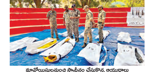
మావోయిస్టులనుంచి స్వాగీనం చేసుకొన్న ఆయుధాలు

చర్ల, మార్చి 29 ప్రభాతవార్త ప్రతినిధి: దండకారణ్యంలో ( ఆడవి) లో ఆకు రాతే కాలం అన్నలకు కష్టం కాలం ఈ వేసవి నాలుగు నెలల వ్యవధిలో ఉద్యమంలో అనేక అటూర్లును ఎదుర్కోవాల్సి వస్తుంది. ఇంతటి దారుణ పరిస్థితిలో తలదాచుకోవడం సవాళ్లతో కూడిన అంశం ఇటువంటి క్షిప్ర సమయంలో మావోయిస్టుల ఏరివేత సునాయంగా సాధించడం వచ్చిన కేంద్రం ప్రభుత్వం మరింత దూకుడు ప్రదర్శిస్తుంది. కేంద్రం చీఫ్ సెక్యూరిటీ రాష్ట్ర ఇంటిలిజెన్స్ వర్గాల సూచనలకు అనుగుణంగా భద్రతా బలగాలు అదవులను జర్రెడ పడుతున్నావు. ఈ క్రమంలో వరస ఎన్కౌంటర్లు జరుగుతున్నాయి. చీఫ్ సెక్యూరిటీ రాష్ట్రంలోని