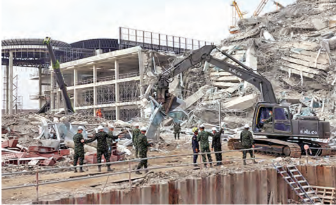
మయన్పూర్ లో శిథిలాలను తొలగిస్తున్న దృశ్యం

మయన్పూర్ లో మళ్లీ కంపించిన భూమి శిథిలమైన పలు అంతస్తుల భవనాలు, బీటలు వాలిన రోడ్లు కొనసాగుతున్న సహాయక చర్యలు