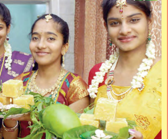
వైద్య వరంగా వ్యాధి నిరోధక శక్తిని ఇస్తుంది. ఇక పోతే ఉగాది పచ్చడి తినిపెట్టుకుంటే పటిష్టతను సంతరించుకొంటాము. పురాణాల్లో కూడా తెలుగు పండుగలకు ఆధిక ప్రాధాన్యత నిచ్చారు. ఇలా అన్నింటా తెలుగు పండుగలకు పెద్దపీట వేశారనే చెప్పాలి. పండుగ వచ్చేదంటే లోగిళ్ళన్నీ మామిడి తోరణాలతో, రంగమబ్బలతో, పసుపు కుంకుమలతో కళకళలాడుతూ ఊరంతా దేదీప్యమానంగా వెలిగిపోతుంటుంది.

మలయాళీలు :విష్ణు అని, సిక్కులు 'వైశా' అని, బెంగాలీలు 'హాయిలాబాయి శాఖ' గాను, అస్సాంలోని 'బిహూ' అని, కేరళలో 'కొల్లవర్షం' అని జరుపు కుంటారు. అలాగే చైత్ర శుద్ధ పాడ్యమిరోజే కలి యుగం ప్రారంభమైంది. రాజుల సంహారం తర్వాత నీతాలక్ష్మణ సమేతుడైన శ్రీ రామచంద్రుడయ్యాడట అయితే తిరుగు ప్రయాణమైంది ఈరోజే. శక పురుషుడైన