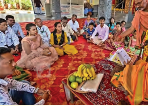
దారిస్తాము. గుమ్మాలకు మామిడి తోరణాలు కడతాము. ఇష్ట దైవాన్ని ప్రార్థించాలి. ఈ ఆచారాల వెనుక ఉన్న ఆంతర్యాలు ఏమిటో చూడండి పర్యటిస్తూ తెలుగు లక్ష్మీదేవి, నీటిలో గంగాదేవి నివాసం ఉంటారు. అందుకని పండగ రోజు తలకి నూనె రాసుకుని తలస్నానం చేస్తే లక్ష్మి, గంగా మాతల అనుగ్రహం నమస్కరిస్తా లభిస్తాయి. ఇక ఉగాది విధానాన్ని తెలిపేది ఉగాది పచ్చడి. జీవితంలో జరిగే వివిధ అనుభవాలకు ప్రతీక. జీవితం అన్న అనుభవాలు కలిగినదైతే ఆర్ధవంతం అని చెప్పే భావం ఇమిడి ఉంది. పచ్చడిలో ఉండే ఒక్కో పదార్ధం ఒక్కో అనుభవానికి ప్రతీక. బెల్లం తీపి, ఆనందానికి సంతకం. ఉప్పు జీవితంలో ఉత్సాహం, రుచికి సంతకం. వేప పువ్వు చేదు, బాధ కలిగించే అనుభవాలకి సంతకం. చింతపండు పులుపు, నేర్చుగా వ్యవహరించవలసిన పరిస్థితులు. పచ్చిమామిడి ముక్కలు వగరు కొత్త సవాళ్ళు. కాకం సహనం కోల్పోయేట్లు చేసే పరిస్థితులు. ఇలా ఇది

పెద్దలు చెబుతారు. మధు మాసంలో వచ్చే సోక బాధలను మన దగ్గరకు రాకుండా చేయడానికి, బాధలు లేకుండా చూడాలని దేవుని కోరడమే ఈ శోభక ఆర్ధం. ఈరోజు పంచాంగ శ్రవణం కూడా ముఖ్యం. ఇది వేద కాలం నుండి ఆనవాయితీగా వస్తున్న ఆచారం. మనకు 15 తిథులు, ఏడు వారాలు, 25 నక్షత్రాలు, 27 యోగాలు, 11 కరణాలు ఉన్నాయి. వీటన్నింటి గురించి పంచాంగం వివరిస్తుంది. వీటితోపాటు నవగ్రహాల సంచారం, వివాహాది శుభకార్యాల సమూహాలు, ధరణులు, వర్షాలు, వాణిజ్యం... ఇలా ప్రజలకు అవసరమైన వాటికి అధిపతి ఎవరు, అందువల్ల కలిగే రాజ్యసమృద్ధి ఏమిటి అన్న విషయాలతో పాటు వేద శాస్త్ర నిబంధనలను సాధించాలి అంటుంది. ఇది వేద కాలం నుండి ఆనవాయితీగా ప్రస్తావిస్తారు. ఇలా ఈ ఐదు అంశాలను ప్రతినిత్యం అనుభవించు ఏ పని చేసినా మంచిగా చేయాలి, మంచి ఫలితాలను సాధించాలి, అందరికీ మంచిని పంచాలి ఇదే పంచాంగంలోని పరమార్ధం. ఇక