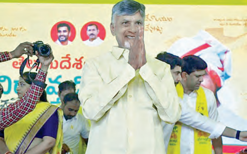
శనివారం మంగళగిరిలో టీడీపీ ఆవిర్భావ సభనుంచి అభివాదం చేస్తున్న చంద్రబాబు

లం కాదన్నారు. టీడీపీని లేకుండా చేస్తామన్న వాళ్లు కాలగర్భంలో కలిసిపోయారని అన్నారు. కార్యకర్తలు కేవలం కాగితాలు ఇస్తే పదవులు రావని, క్షేత్రస్థాయిలో పని చేయాల్సిందేనని సీఎం చంద్రబాబు స్పష్టం చేశారు. పార్టీకి మనమంతా వారసులమే కానీ పెత్తందారులం కాదన్నారు. పార్టీనే ప్రాణంగా బతికే పసుపు సైన్యానికి సీఎం చంద్రబాబు పాదాభివందనం తెలిపారు. పశంసించారు. భావితలకాల భవిష్యత్తుకు అందగా నిలిచే పాలసీలు తెచ్చిన జెండా మన పసుపు జెండా అని చంద్రబాబు తెలిపారు. ప్రతి కులానికి న్యాయం చేసే ఏకైక పార్టీ తెలుగుదేశం మాత్రమేనని తెలుగుదేశం అధినేత చంద్రబాబు స్పష్టం చేశారు. రాజకీయాల్లో ఎప్పుడూ లేని సంస్కృతి గత 5 ఏళ్లలో చూశామన్నారు. ఆస్తుల విధ్వంసం జరిగినా, రాజకీయ హత్యలు చేసినా, ఆర్థిక మూలాలు దెబ్బతీసినా కార్యకర్తలు ధైర్యంగా ఎదుర్కొన్నారు గుర్తుచేశారు. మంచికి మంచిగా ఉండే మనం, తప్పు చేసి తప్పించుకోవాలనుకునే వారినీ మాత్రం ఉపేక్షించమని చంద్రబాబు హెచ్చరించారు. చెడును శిక్షించకపోతే మంచిని కాపాడలేమని అన్నారు. కార్యకర్తలు మాషారుగా ఉంటే తెలుగుదేశం పార్టీకి తిరుగలేదని తెలిపారు. కార్యకర్తల్లో హుషారు తగ్గినప్పుడే విపక్షం పుంజుకునే ప్రయత్నం చేస్తుందన్నారు. ప్రతి తెలుగుదేశం కార్యకర్తకు తప్పనిసరిగా గుర్తింపు ఇవ్వమన్నారు. ప్రజల మట్టు తిరిగి కార్యకర్తలకు, >>2